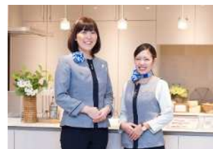
※TOTOビジネス株式会社は、TOTO株式会社（東証一部上場）100%出資会社です。 （紹）40-ユ-300857